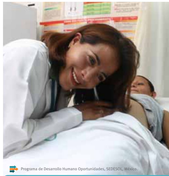
Programa de Desarrollo Humano Oportunidades, SEDESOL, México.

En este sentido, el CIEE desarrolla estudios de evaluación económica como una herramienta para generar información que permita contribuir a la eficiencia de las acciones en salud y en desarrollo social. El objetivo de estos estudios es promover la utilización de recursos de forma tal que se maximicen los resultados en salud y bienestar en términos de sus costos y beneficios.